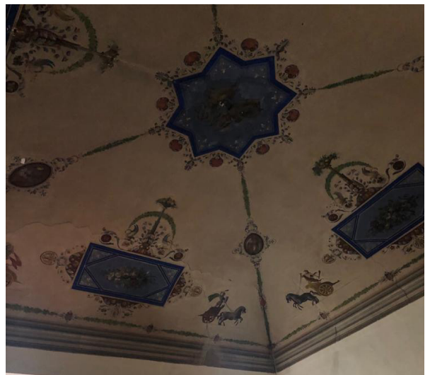
FOTO SIGNIFICATIVE DELLA STANZA

LASCIARE A VISTA IL SOFFITTO AFFRESCATO.